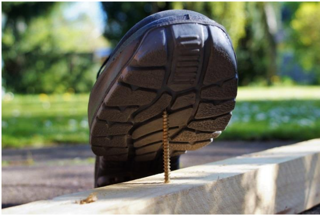
Gut behütet in den Dienst. Dazu zählen auch Sicherheitsschuhe

Die Richtlinien zur Unfallverhütung und Arbeitssicherheit gelten auch für die minderjährigen Helfer. Wenn die*der Minderjährige Angehörige*r der Bereitschaft ist, so ist die Dienstbekleidungsordnung einzuhalten. Angehörige des JRK sollen mindestens festes Schuhwerk, lange Hose (z.B. Bonn 2020) und JRK-Oberbekleidung tragen; nach Möglichkeit kann auch eine Jacke gemäß Bekleidungsrichtlinien JRK hinzukommen. Weiterhin sind die aktuellen Unfallverhütungsvorschriften einzuhalten, hierzu muss eine Absprache der Gemeinschaftsleitungen erfolgen; z.B. sind bei Bedarf Helm und Handschuhe zu nutzen.